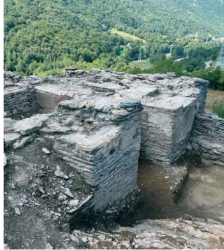
Rèstes de Castèth Leon dempús des cataments arqueologics deth 2011

En planhèth petit que s'alongaue dejós de Garona alimentada peth Joeu, eth batalhon de Flandes susvelhaue eth camp, eth parc d'artilheria, es depòsits de municions, es magazins, es horns e es ambulàncies.