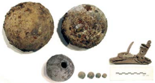
Projectils desparièrs e panh miquelèt trapadi en Castèth Leon